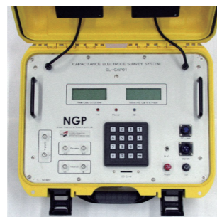
高周波交流電気探査装置本体

● 全国の自治体および水道事業体への普及・展開を目指す。また、老朽水道管を対象とした調査だけでなく、非破壊で舗装路面下の空洞等を調査する技術への展開が可能