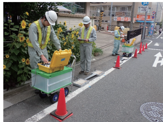
高周波交流電気探査の測定状況