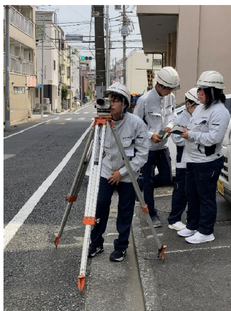
屋外での水準測量