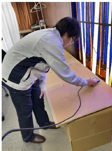
金属探知器を使用した宝さがしゲーム