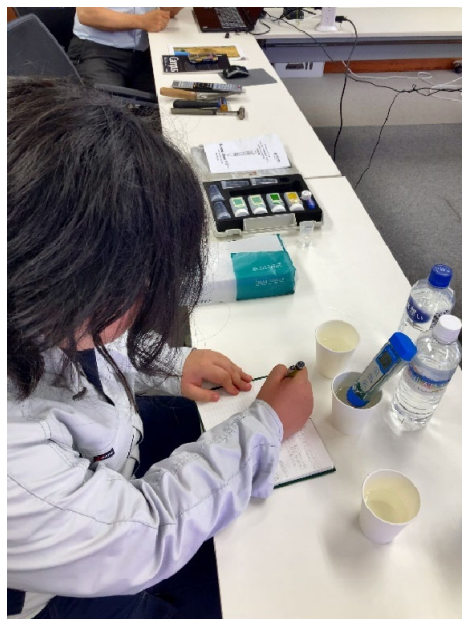
水の pH 測定